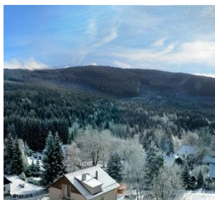
Nejvyšší bod Šumavska